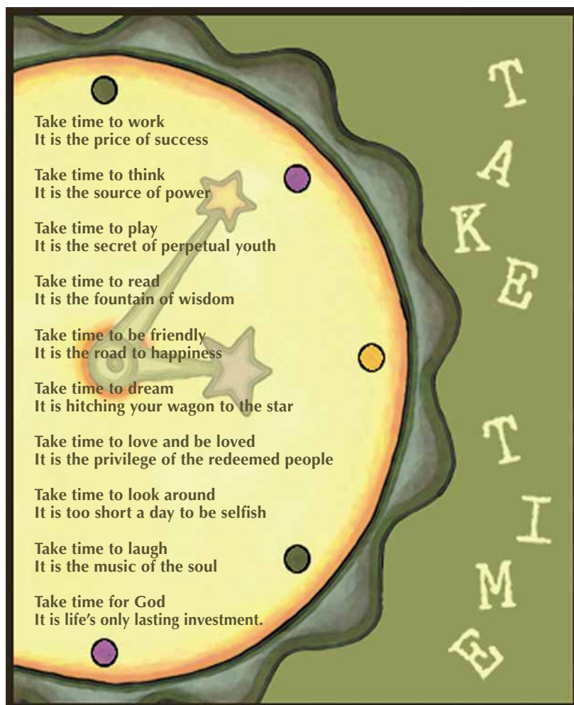
De vertaling van het gedicht: zie Facebook en de site van de Raad van Kerken.

Tijd is een kostbaar geschenk. Hoe ga je daar mee om? Ken je kwaliteits-tijd? Welke prioriteiten stel je? Bepaal jij je agenda, of bepaalt je agenda jou? Leven in het nu voorkomt dat je alleen maar terugdenkt aan de goede tijden van vroeger, of bezig bent met het bouwen aan luchtkastelen voor later. Vandaag is de dag dat je leeft! Ren er niet aan voorbij.