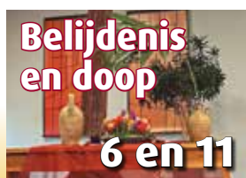
Belijdenis en doop 6 en 11