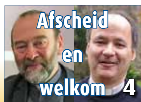
Afscheid en welkom 4

Ik kan me voorstellen dat voor de lezer van 2020 de woorden schepping en herschepping wat bevreemding kunnen wekken. We weten toch allemaal dat de wereld niet in zeven dagen geschapen is. Sinds Darwin heeft de evolutieleer overal ingang gevonden, ook bij het overgrote deel van de christenen. >