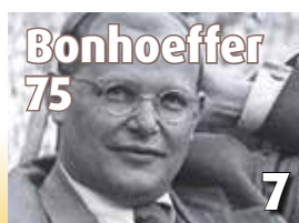
Bonhoeffer 75 7