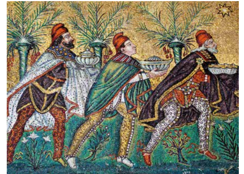
Mozaïek van de drie magiërs, begin van de 6e eeuw. Basiliek Sant'Apollinare Nuovo, Ravenna, Italië

'Voor mij als Iraans christen is dit feest bijzonder. Stiekem ben ik onder de indruk van deze oude Perzische mannen en leer ik graag van hen. Om te beseffen wat hen bijzonder maakt, hebben we een beetje geschiedenisles nodig.