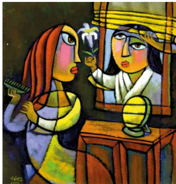
De engel verschijnt aan Maria, He Qi