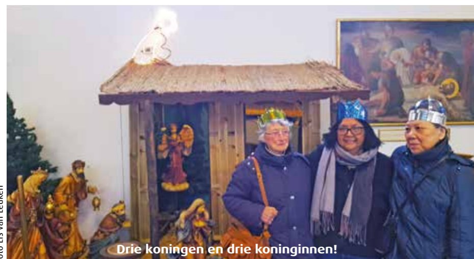
Drie koningen en drie koninginnen!