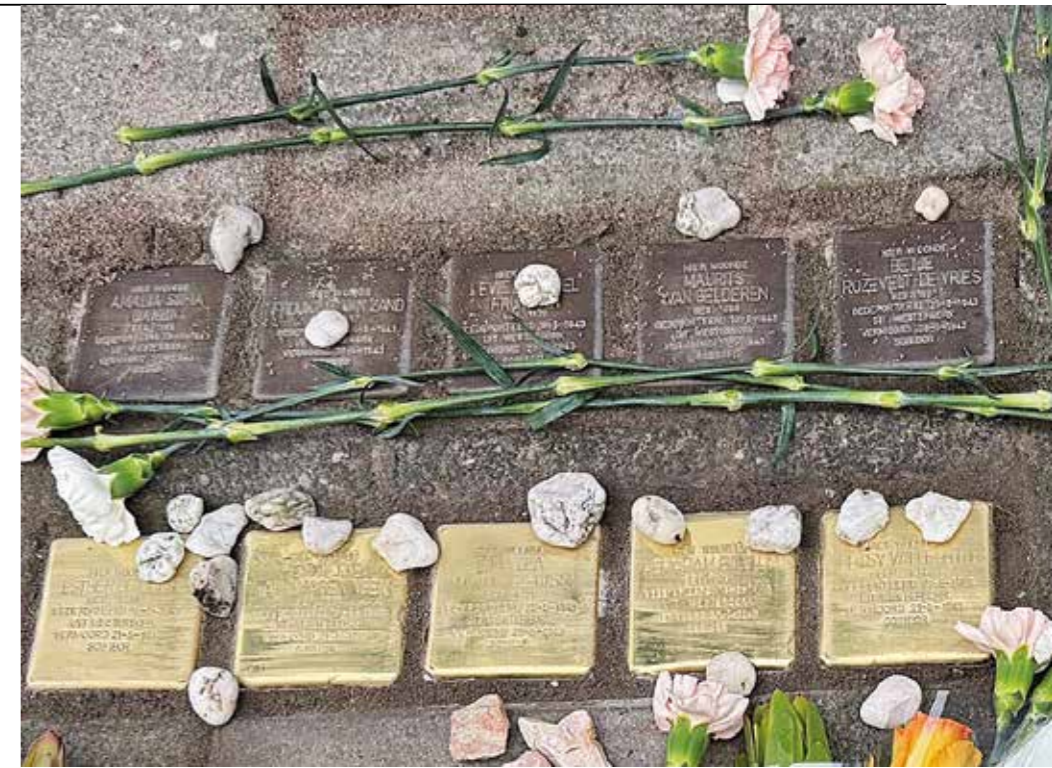
Nieuwe Stolpersteine bij GGZ Rivierduinen