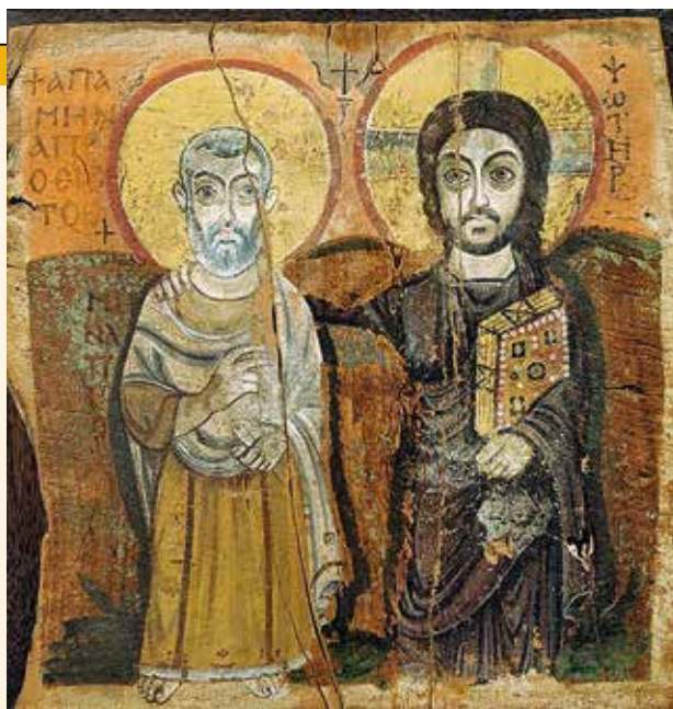
Icon van de Vrienderschap, Christus en St. Menas